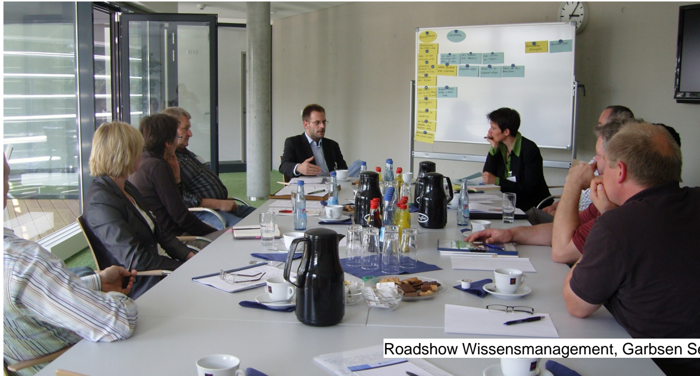
Roadshow Wissensmanagement, Garbsen September 2009